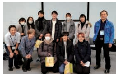
神戸大学生・教員・人と防災未来センターの皆さん