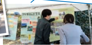
神戸大学ボランティアバスプロジェクト 神戸大学持続的災害支援プロジェクトKonti