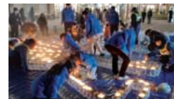
災害ボランティア・慰霊祭