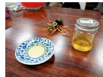
ラボでとれた蜂蜜です

うちの研究室では研究の一環で蜂蜜をとることがあり、研究室の人と一緒に蜂蜜絞りをするのが楽しいです。また、大学生協のアルバイトでポスターやチラシを作らせてもらうことがあり、実際に完成したものが構内に貼られているのを見るとテンションが上がります。