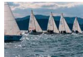
ヨットレースの様子。全長7m程度のヨットを5人で動かし、速さを競います。