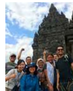
短期留学にも行きました。写真はインドネシアのプランバナン寺院