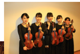
↑学生最後の演奏会で撮ったヴィオラの同期メンバーの写真。この演奏会では、1800名を超えるお客様に会場にいらしていただきました。

学部時代は4年間、神戸大学交響楽団に所属していました。私は大学から楽器を始めたので、周りのみんなに支えられながら、年2回行う大きな演奏会に向けて活動に取り組んでいました。