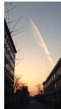
(海事科学部キャンパス)