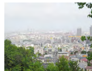
(六甲キャンパスからの景色)

海事科学部キャンパスからは離れていましたが、六甲のキャンパスで少林寺拳法部に所属していました。原付があるととても便利です。