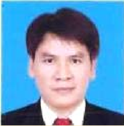
ラオス国立大学(ラオス) ラオス日本センター 副センター長

National University of Laos Laos-Japan Human Resource Development Institute Deputy Director