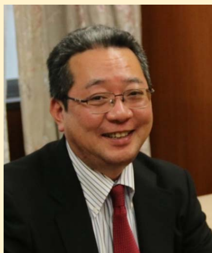
神戸大学 理事・副学長 国際交流推進機構長