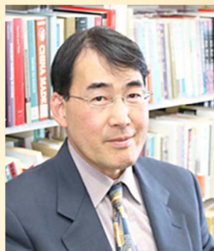
神戸大学国際交流推進機構 アジア総合学術センター長

A new program named "Educational Program on Current Japan" has started in October. It is taught entirely in English and examines a wide range of subjects including Japanese pop culture and scientific technology. It is my hope that the Forum will form close links with this program in order to expand the network of specialists in Japanese Studies.