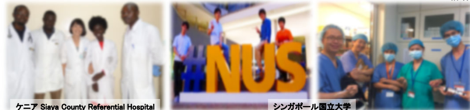
ケニア Siaya County Referential Hospital