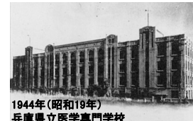
1944年(昭和19年) 兵庫県立医学専門学校