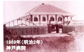
1869年(明治2年) 神戸病院