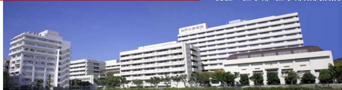
現在の医学部・医学部附属病院