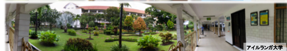
アイルランガ大学