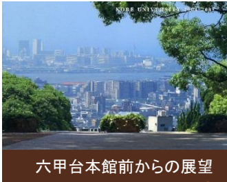
六甲台本館前からの展望