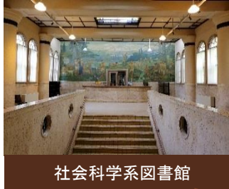
社会科学系図書館