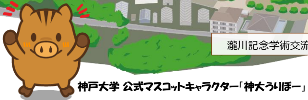
神戸大学 公式マスコットキャラクター「神大ういほー」