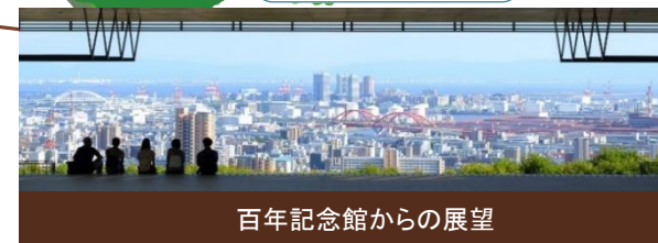
百年記念館からの展望