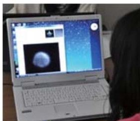
X線で見える宇宙： 「ティコの超新星残骸」画像を調べる

関西科学塾は、関西の大学や企業等が連携して女子中高生に理系の研究・実験等の面白さを伝える体験型イベントです。神戸大学は初年度から参加しており、今回は26名の女子高校生が参加して11月に5つの実験実習を行いました。高校生たちは大学の研究室での実験実習を体験したり、実験のサポートをしてくれた大学生と交流することで、大学で研究をすることに対する関心をより強くしたようでした。