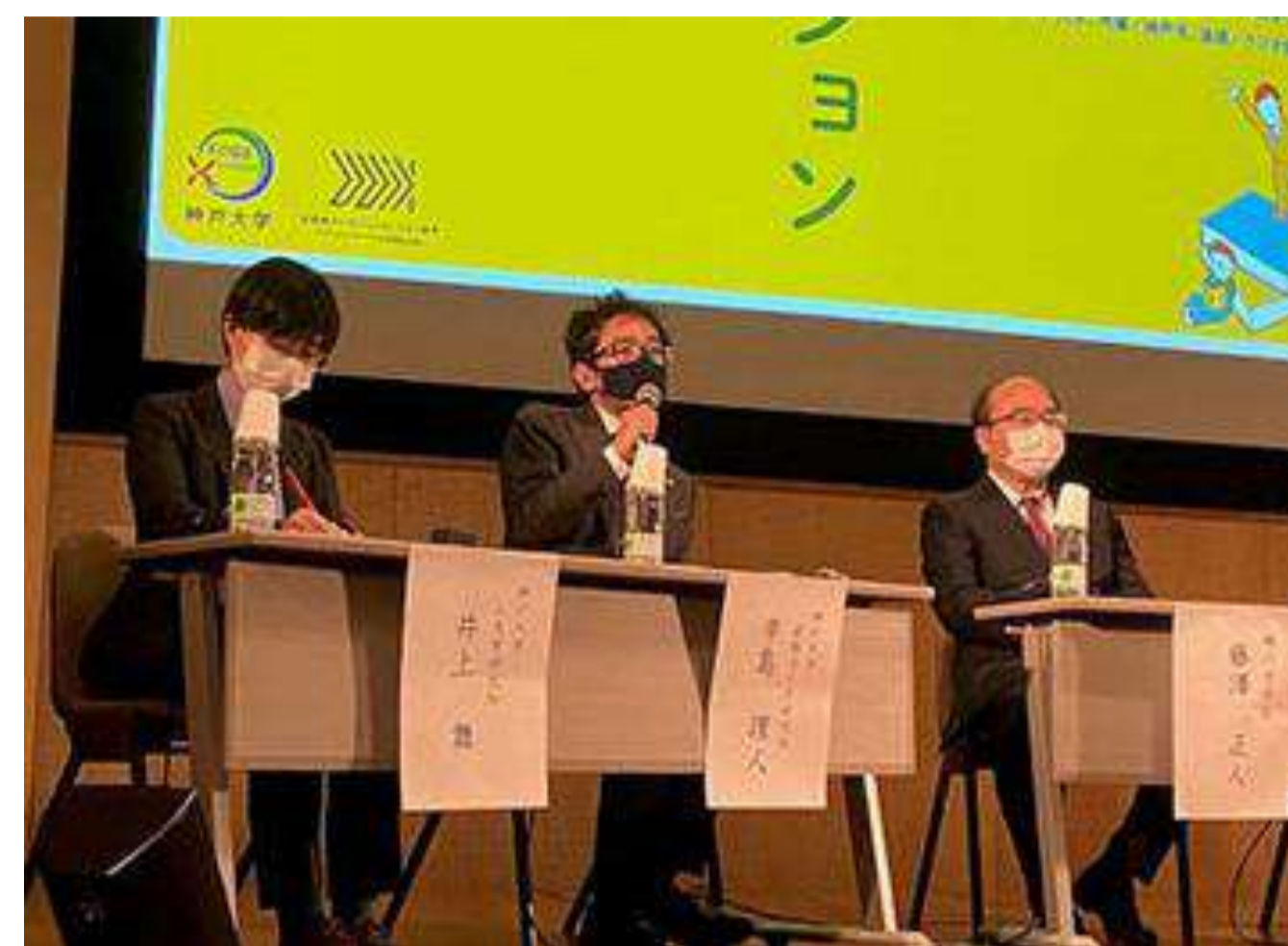
若手研究者4人が研究成果を発表 (神戸大学百年記念館六甲ホール)