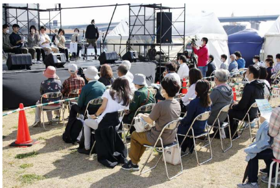
神戸大学学生震災救援隊が27年間の活動の振り返り・歴史を「学生による防災体験&展示会」に単独で出展しました。

夏日の中、沢山の参加をいただき、東北の岩手大学や福島大学からも学生が参加してくれました。神戸大学を卒業し、社会で活躍している先輩たちよりボランティア・社会貢献の重要性とともに、今も続く阪神・淡路大震災の社会的影響についてのコメントがありました。