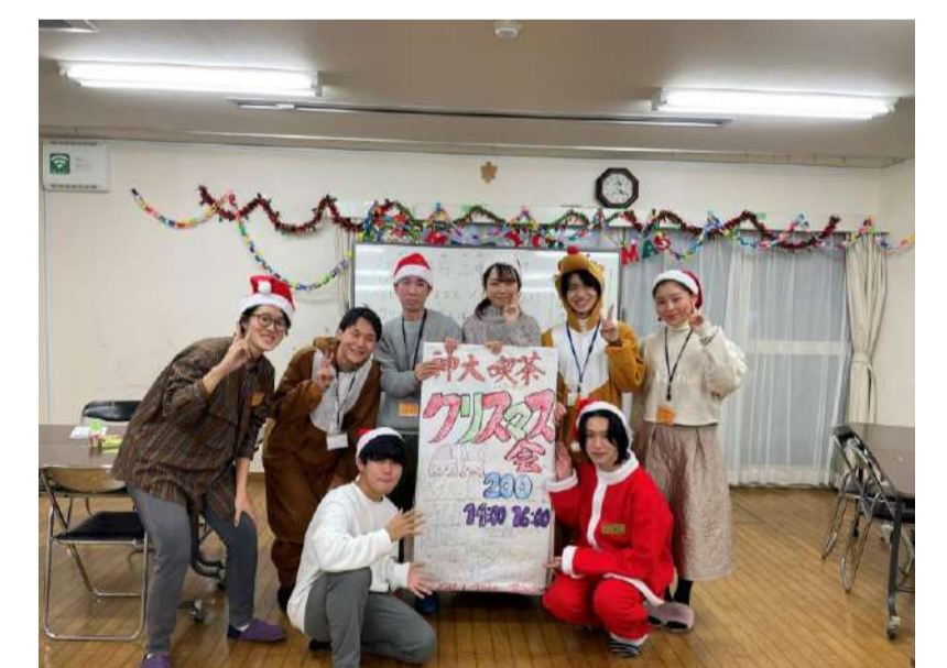
神戸大学学生ボランティア団体 灘地域活動センター(N.A.C.)

その後の交流会では①広報、②地域連携について話し合い、対面での交流を増やしたり、互いの活動を訪問するなどの意見があり、今後、一層の展開が期待されます。