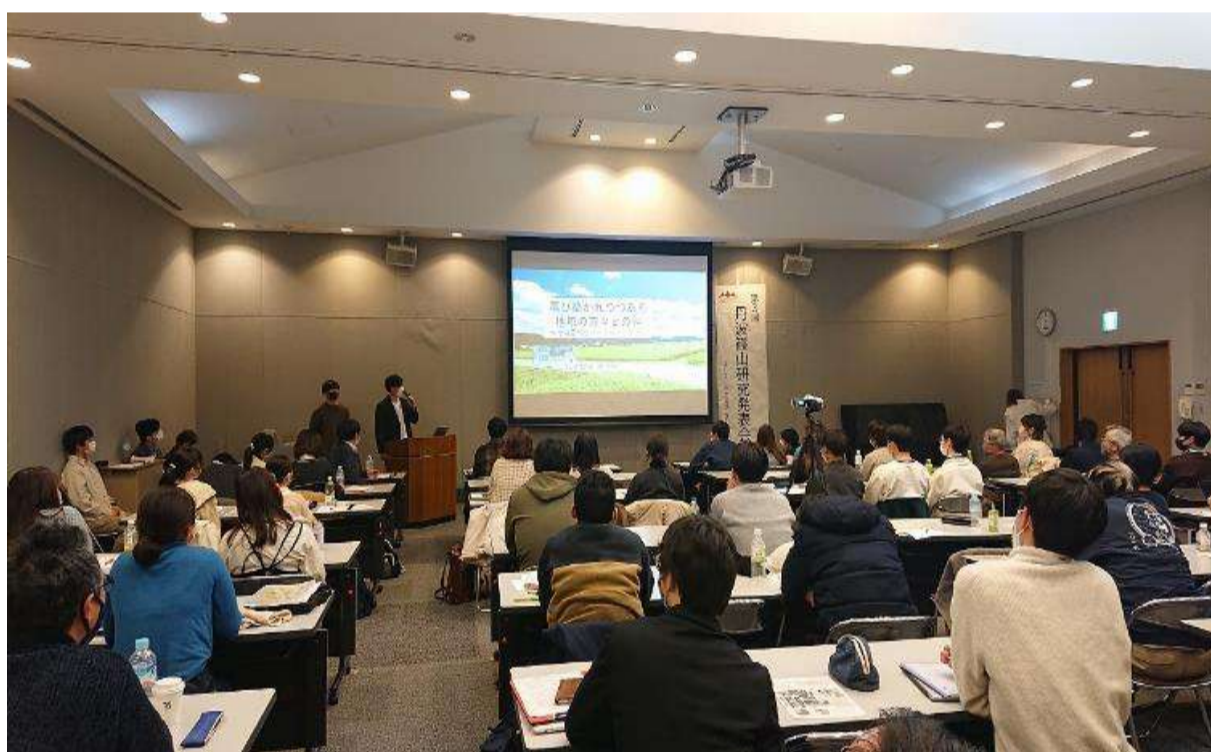
丹波篠山市民センター 令和5年2月26日