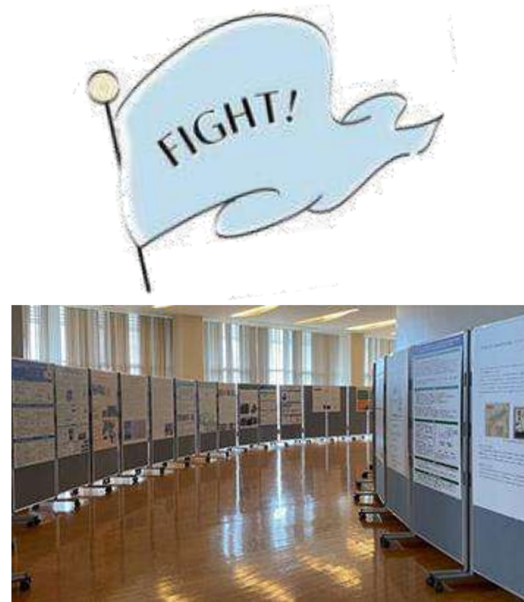
会場で一部の研究内容をパネル展示した