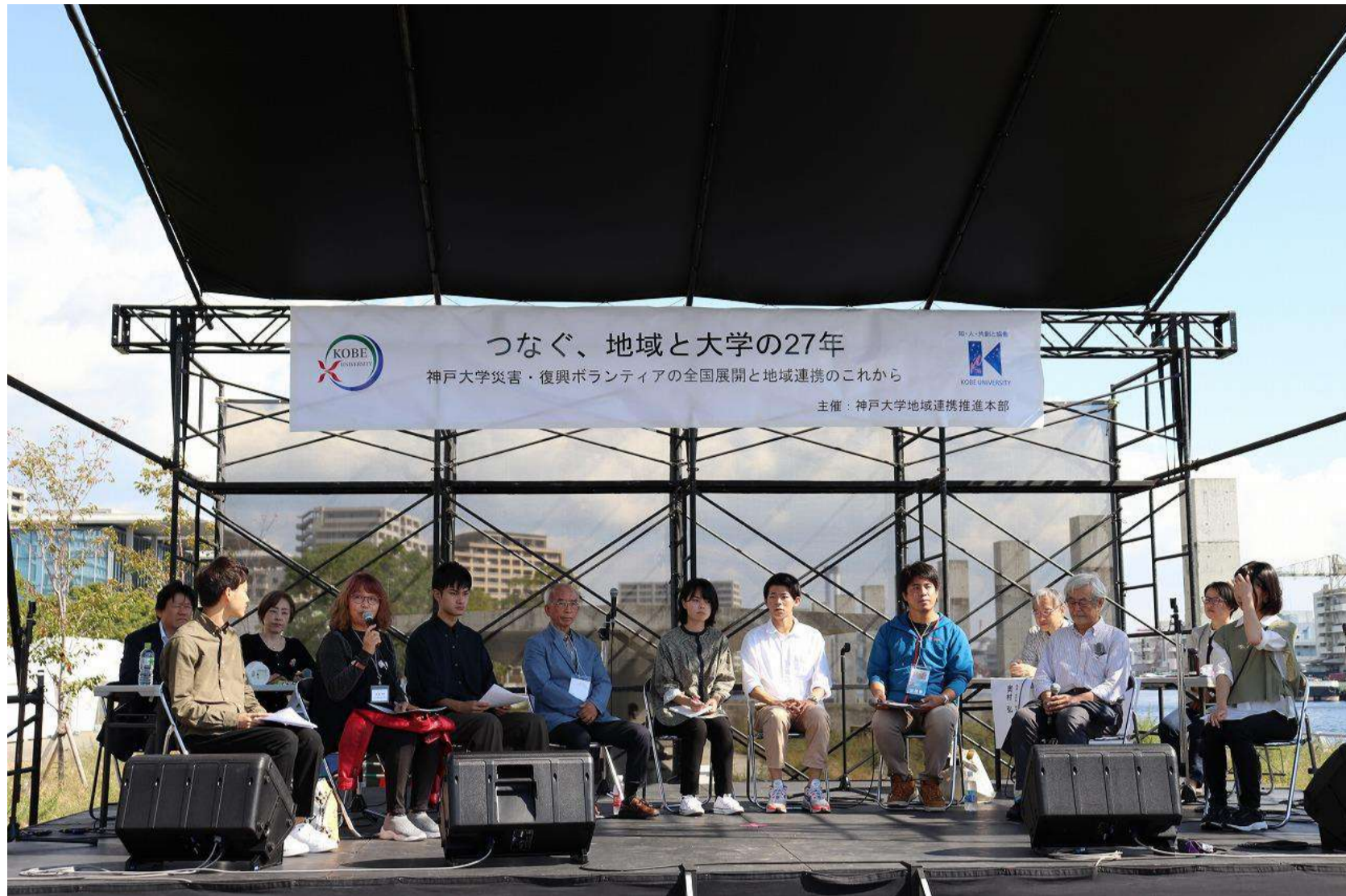
神戸大学学生震災救援隊 神戸大学総合ボランティアセンター 神戸大学東北ボランティアバスプロジェクト 神戸大学持続的災害支援プロジェクトKonti

夏日の中、沢山の参加をいただき、東北の岩手大学や福島大学からも学生が参加してくれました。神戸大学を卒業し、社会で活躍している先輩たちよりボランティア・社会貢献の重要性とともに、今も続く阪神・淡路大震災の社会的影響についてのコメントがありました。