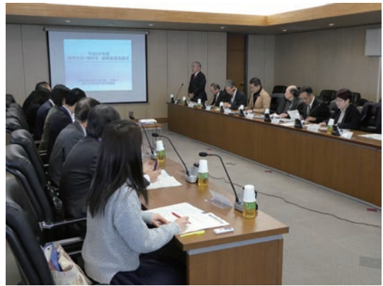
神戸大学で開催された協議会

協議会での多方面からの議論を経て、さらに事業が深化し、次の連携の広がりにつながることが確認できました。