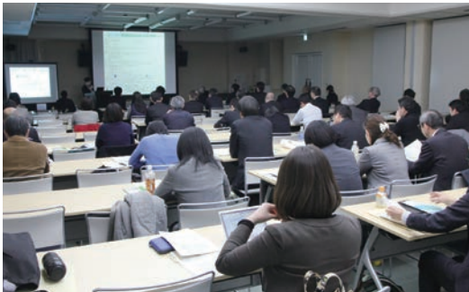
報告を聞く参加者ら

平成29年1月27日(金)に、標記シンポジウムを神戸大学瀧川記念学術交流会館で開催しました。