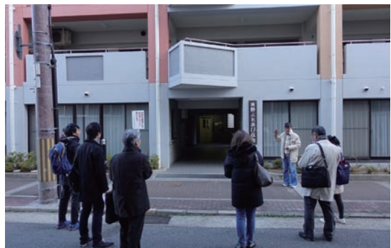
まち歩き会の様子