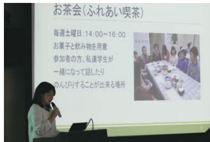
灘区で活動を行う学生の報告

会場ではシンポジウム終了後も積極的に意見交換をする姿が見られ、地域連携を軸に様々な人とのつながりを広げられた機会となりました。