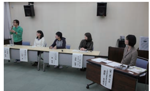
第2部での意見交換