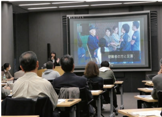
学生震災救援隊からの報告

平成28年12月10日(土)、本学が取り組むCOC+の安心安全な地域社会領域の一環として、標記シンポジウムを開催しました。約45名の方々に参加いただき、熊本地震で被災された方々の現在の生活状況や復興の状況とその課題を共有し、住民を主体とした安心安全なまちづくりについて意見交換を行いました。