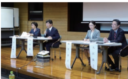
第1部：総合討論の様子