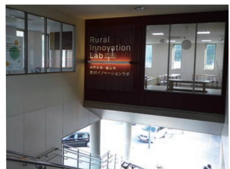
JR篠山口駅すぐのラボ