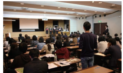
第3部：学生による報告