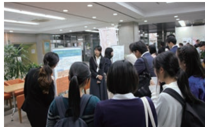
第2部：ポスター掲示の様子