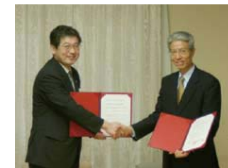
朝来郡生野町（現 朝来市）